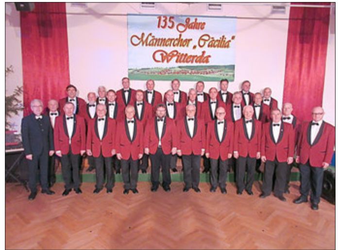
Sängerfest zum 135. Chorgeburtstag