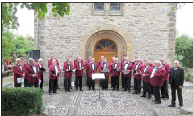
Chor beim Kapellenfest 2019