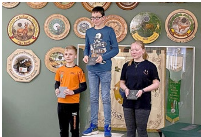
Siegerehrung Schüler 2. Wettkampf

Insgesamt war es für die kleine Disziplingruppe Laufende Scheibe ein erfolgreicher und spannender Wettkampf bei perfekter Organisation durch den Gastgeber, den SV Mellenbach-Glasbach 73 eV.