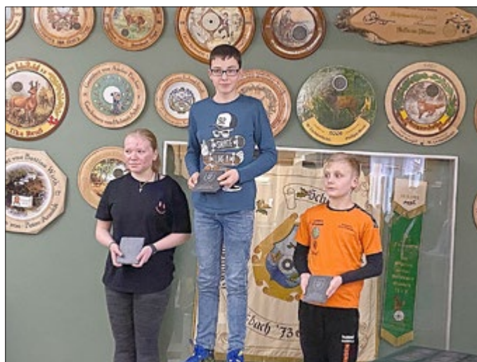
Siegerehrung der Schüler 1. WK

Bei den Junioren und den Damen waren keine Elxlebener am Start.