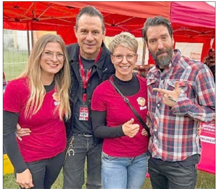
Autor: Sebastian Fernschild