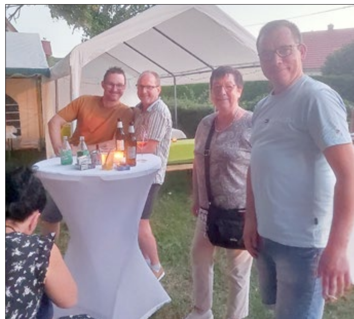
Der Frauenchor aus Walsleben und der Witterdaer Männerchor sangen Lieder zum Zuhören und Mitsingen.