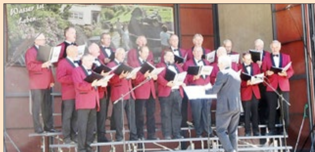
Auftritt am 4. Juni '23 beim Chorfest INCANTARE in Friedrichroda