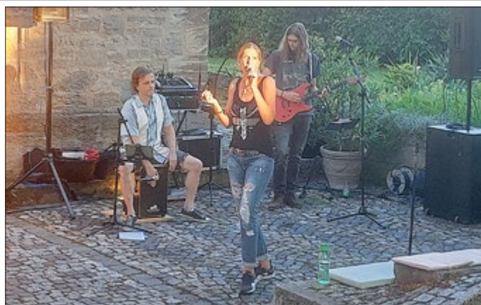
Die Band „Just Brill“ spielte bekannte und eigen geschriebene Lieder, welche zum Tanzen und Mitsingen einluden.