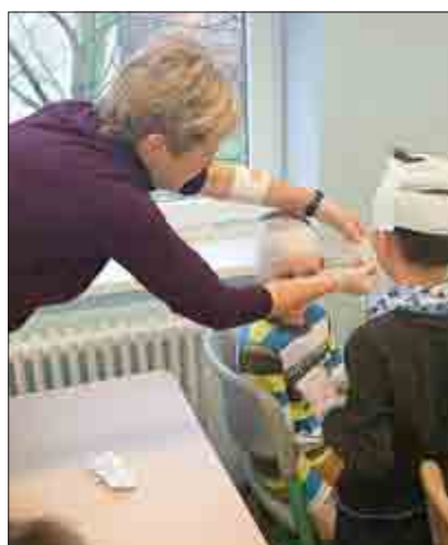
Gefährlich aussehend, aber immer mit einem Lachen im Gesicht, wirkt das Klassenfoto „Heldhaft“.

Die Klasse 3a der Grundschule Walschleben hatte Besuch von einem ehrenamtlichen Mitglied des DRK. Auf spielerische und spannende Weise wurde das Thema - Erste Hilfe - besprochen. Die Kinder malten eine Hand aufs Papier, womit man die 5 wichtigen Fragen beim Notruf nicht vergisst. Natürlich kam die Praxis dabei nicht zu kurz. Beim Anlegen der Verbände hielt es dann keinen Schüler mehr auf seinem Sitzplatz aus. Kaum zu glauben, wie viel Verbandsmaterial um ein Kind passt!