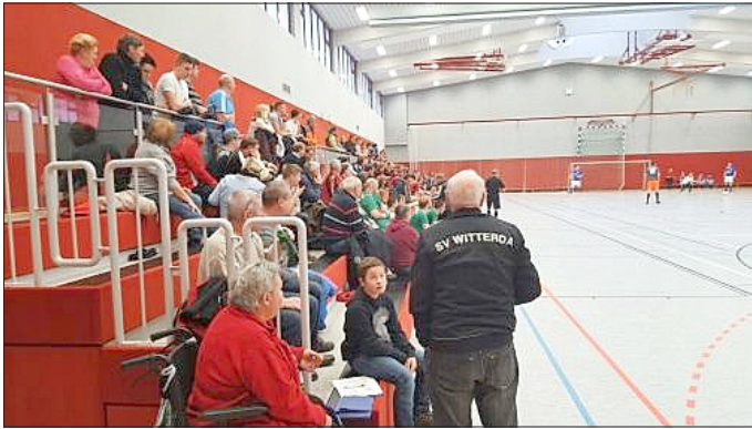
Die Ränge füllten sich zu jedem Turnier mit Zuschauern.

Die Kindermannschaften der E-Junioren begannen ihr Turnier am Sonntagvormittag. Auch da kämpften alle Mitspieler mit Fairness um gute Plätze.