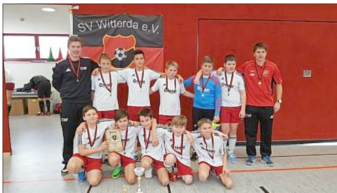
Unsere D-Junioren mit seinen Trainern

Am Nachmittag kämpften die Mannschaften der Männer gegeneinander. Dabei ergaben sich folgende Ergebnisse: