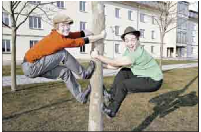
Als Schmankerl warten witzige Choreografien und kleine Gedichte zwischendurch.